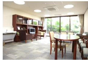
※居室・リビング・中庭は2012年11月撮影